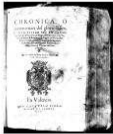
La 'Cronica de Jaume I' en l'edició valenciana de 1337.