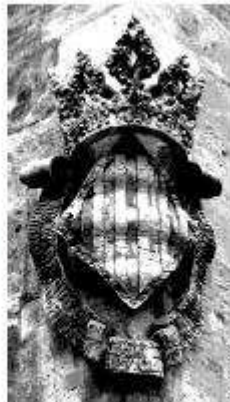
Antic emblema coronamentari dels reis de València (1462-1492) de la ciutat de València.

El casal de Barcelona és el que dóna origen al regne de Catalunya, que té continuïtat amb les dinasties dels Trastàmara i dels Àustries. Sovint hi ha un cert recel a acceptar aquesta darrera etapa com una part del conjunt, però hem de dir que hi ha continuïtat en l'estat, en una estructura de dret públic perfectament diferenciada i en uns territoris que, malgrat els canvis, es reconeixen integrants del regne.