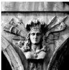
Figura d'Àfrica a l'entrada del Palau de la Generalitat de Catalunya.

Després, a més dels seus espais, la nau de la porta de l'edifici. Després, a més dels seus espais, la nau de la porta de l'edifici.