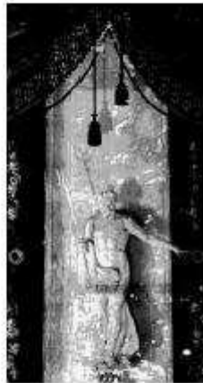
Napoli a l'entrada del Palau de la Generalitat de Catalunya.