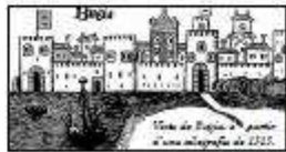
Vista de Ripoll a partir d'una il·lustració de 1215.