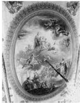
El relleu representant el descobriment d'Amèrica al Palau de la Generalitat de Catalunya.

Figura d'Àfrica a l'entrada del Palau de la Generalitat de Catalunya.