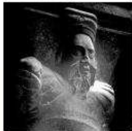
En un capítol del llibre del comte de Ripoll trobem referències als governants que són possibles antecessors d'Enric II.