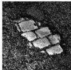
Quan s'interessa amb la història, el fet és clar: el fet és clar.

Aquesta exposició mostra com el descobriment del continent americà i la seva primera colonització són obra de govern de la monarquia Catalana. I això per dos motius bàsics: primer, perquè en aquell moment és l'única potència europea amb capacitat per a poder-ho fer; i segon, per les mostres que d'aquest fet es troben cada dia aquí i a Amèrica.