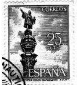
Estampeta de Catalunya i el descobriment d'Amèrica.