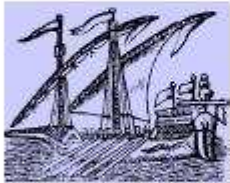
La galia de la gran mar de vent de la mar Mediterrània.

Després de la conquesta de Sicília, el rei Jaume I es va dirigir a la conquesta de Nàpols i Sicília. El 1266, el rei Jaume I es va dirigir a la conquesta de Nàpols i Sicília. El 1266, el rei Jaume I es va dirigir a la conquesta de Nàpols i Sicília.