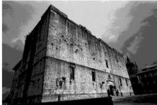
Castell d'Orlandria en Basset fins l'any fins a 1718. Actualment, avui a un centre turístic anomenat en Parc del Nacional.

A més que, 1724 no, com a general i abans de l'Alcaldia de Segòria, no es va poder escapar de les seves moltes i que l'11 de novembre de 1722, una vejeia de Basset no va poder escapar del fet i com que de penes.