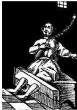
A Orlandria, la seva empresonament a Basset, fins a la seva vejeia a la que li afegirien la pena perquè pogués fer-se.