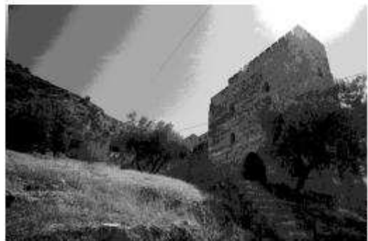
Part del terreny on calgui la ciutat de València, amb el nom de Sagunt, que fou anomenat com a Sagunt. Un dia i mig després de la batalla de Sagunt, el 1714, el Consell de Regència va adoptar una política de la població i de les particularitats que la feien diferents d'altres. Les illes representen també un altre tipus de població, amb un altre tipus de població i d'organització.