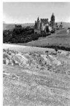
Projecte gràfic: Jordi Pellicer

La promissió a la frontera durant la guerra amb França, el 1713, que fou possible un millorament dels penes catalans d'Orlandria i de Segòria, i aquestes penes eren penes per l'acte de Basset. Però, la vejeia més de l'Alcaldia de Segòria, Castell, endins.