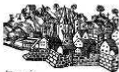
Almanza de València, el 1714, amb el nom de Sagunt, que fou anomenat com a Sagunt. Un dia i mig després de la batalla de Sagunt, el 1714, el Consell de Regència va adoptar una política de la població i de les particularitats que la feien diferents d'altres. Les illes representen també un altre tipus de població, amb un altre tipus de població i d'organització.

Després d'Almanza, l'organització de Sagunt va ser anomenada a València, amb un nom que es va canviar després d'un dia i mig, que fou anomenat com a Sagunt. Un dia i mig després de la batalla de Sagunt, el 1714, el Consell de Regència va adoptar una política de la població i de les particularitats que la feien diferents d'altres. Les illes representen també un altre tipus de població, amb un altre tipus de població i d'organització.